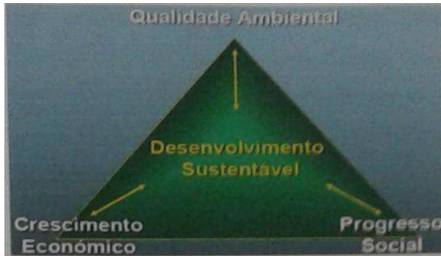
Figura 1 - Triângulo equilátero de base do desenvolvimento sustentável