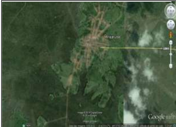
Figura 3 – Foto de satélite do município de Anajatuba