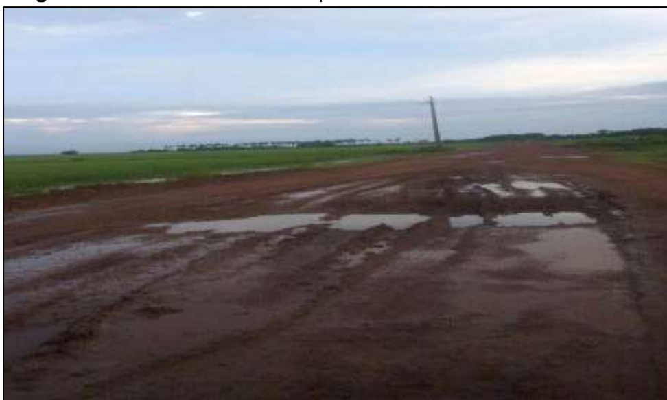
Figura 9 – Estrada de acesso ao povoado Rosarinho

Outro elemento é a precária ou inexistente infraestrutura urbana. Não há água encanada, pavimentação e rede de esgoto, embora exista eletrificação através do Programa “Energia para Todos” do Governo Federal, como mostra a Figura 8.