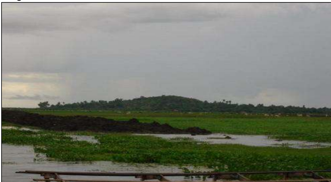
Figura 8 – Vista do morro do Pacoval