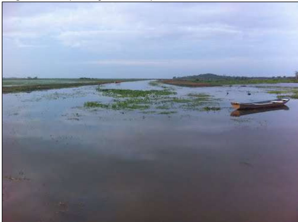
Figura 5 – Campos alagados de Anajatuba com Morro do Pacoval ao fundo

O nome peculiar vem de uma pequena fruta que havia em abundância na região, o anajá. Nesse sentido, o termo “Anajatuba” vem da junção de duas palavras de origem indígena: “anajá” e “tuba”, sendo este último termo significando “abundância”. Assim, “Anajatuba” quer dizer “abundância de anajá”. É importante ressaltar que a planta que deu origem ao nome do município tornou-se raridade na região, ficando quase extinta.