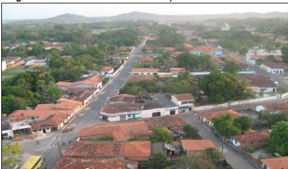
Figura 6 – Vista aérea do centro de Anajatuba

Elevado novamente à categoria de município com a denominação de Anajatuba, pelo decreto nº 870, de 05 de julho de 1935, Anajatuba foi desmembrada de Rosário. Finalmente, em divisão territorial datada de 1º de julho de 1960, o município passou a ser constituído de dois distritos: Anajatuba e Porto das Cabarras. Assim permanecendo em divisão territorial datada de 2005 (DIAS, 2006).