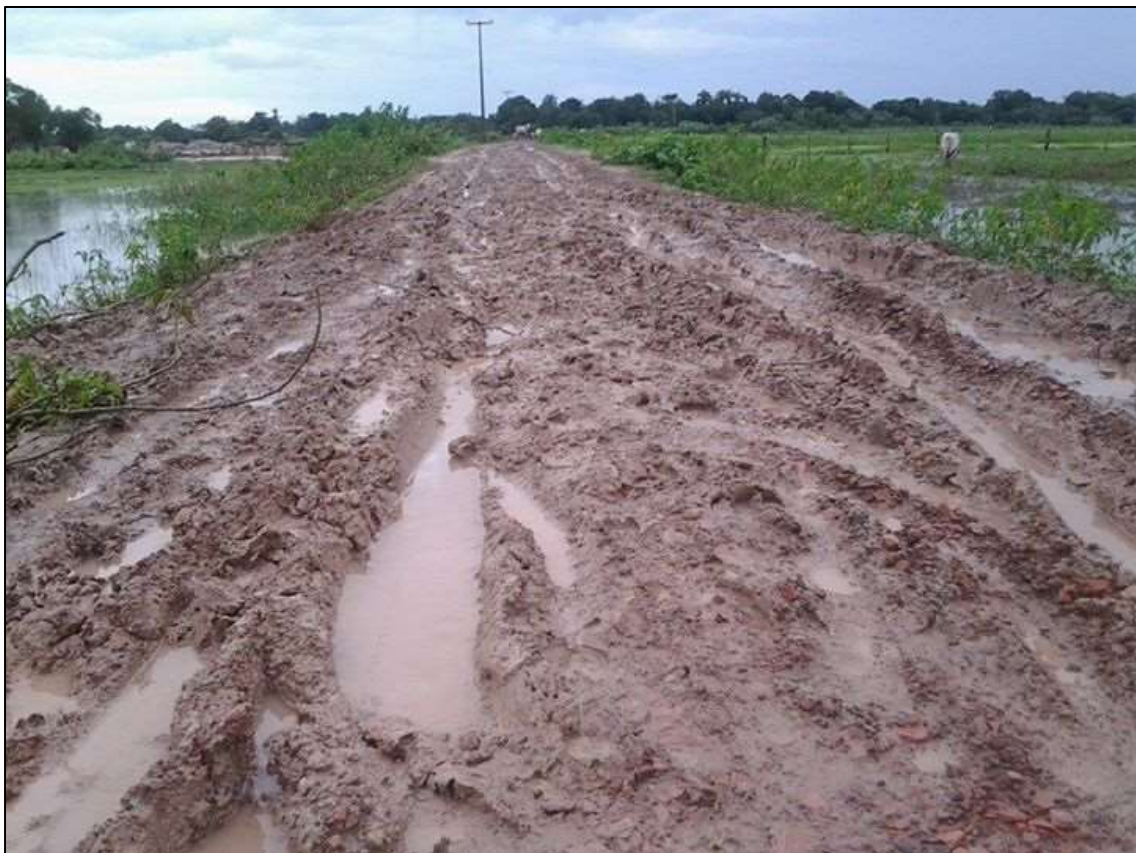
Figura 7 – Estrada de acesso ao povoado Pacoval

Distante três quilômetros da sede do município de Anajatuba, o povoado Pacoval está situado no meio dos campos que ficam alagados nos períodos chuvosos, tendo como único meio de ligação com a cidade um aterro de piçarra que frequentemente é rompido pela força das chuvas. Assim, por ser uma ilha durante o inverno, a única ligação do povoado com a sede municipal é feita por pequenos barcos que trafegam pelos canais alagados, fator que dificulta bastante a acessibilidade no período chuvoso.