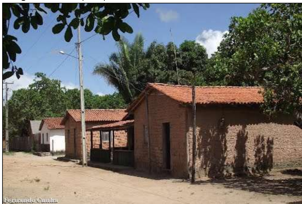
Figura 10 – Rua principal de Rosarinho