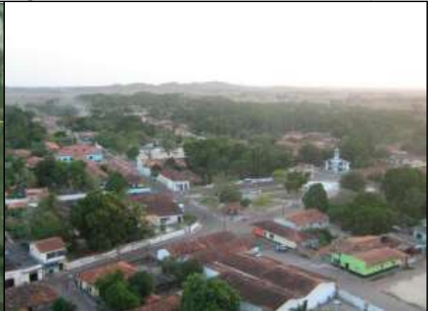
Figura 4 – Foto aérea do centro de Anajatuba