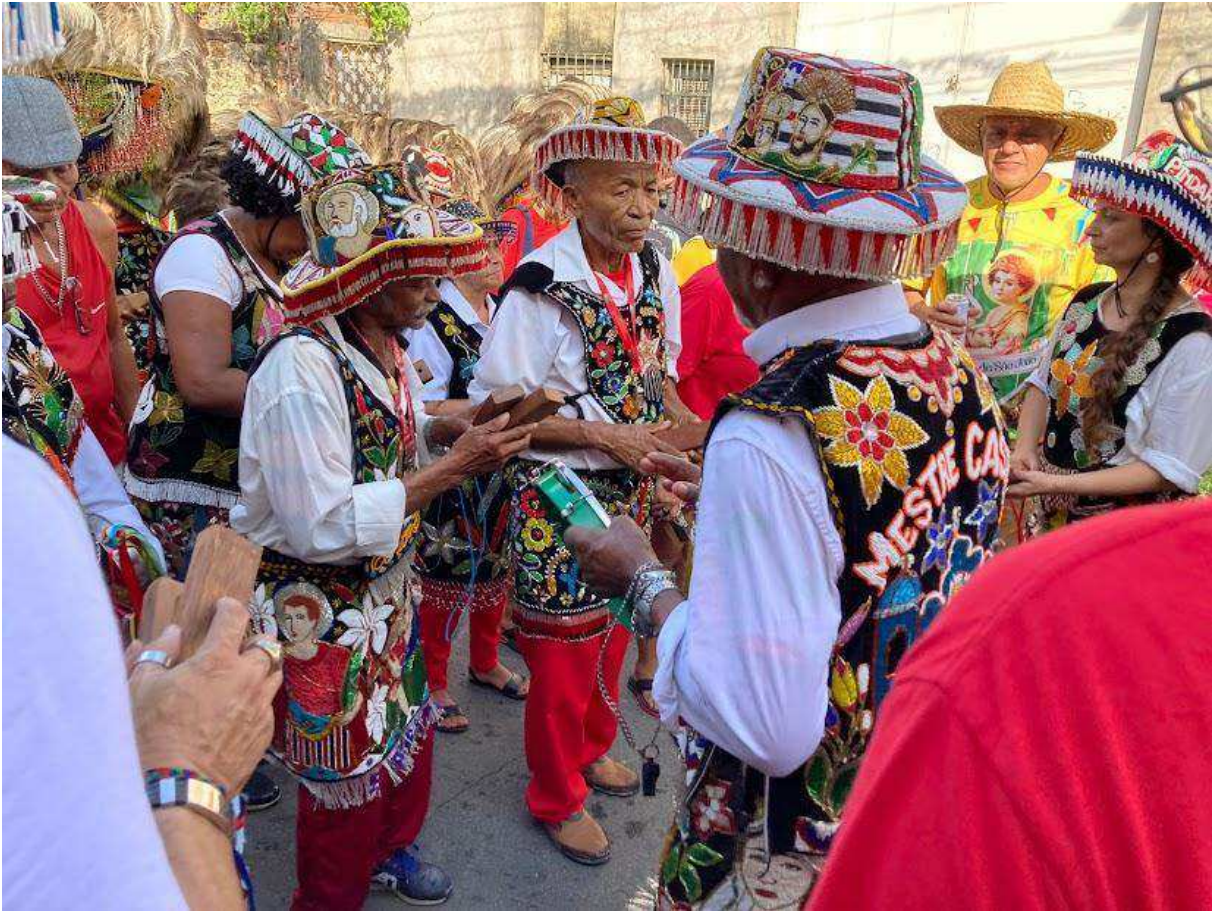
Fotografia 3: Cantadores reunidos no dia 29 de junho de 2024, tirando toadas e descendo a rua, no bairro da Madre Deus, rumo à Capela de São Pedro.