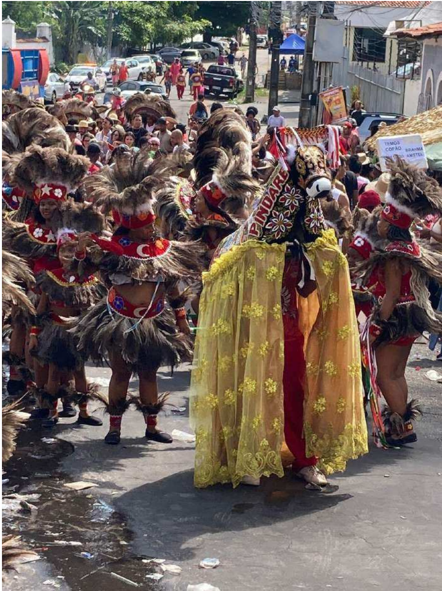
Fotografia 16: No dia 29 de junho, um ato final de devoção, o Boi de Pindaré e sua tribo sobem a ladeira rumo ao Largo da Capela de São Pedro. Sendo o último grupo a subir a escadaria, este momento solene consagra o pagamento de promessas e a fé da comunidade ao santo protetor dos pescadores, finalizando a festa em uma tradição ancestral.