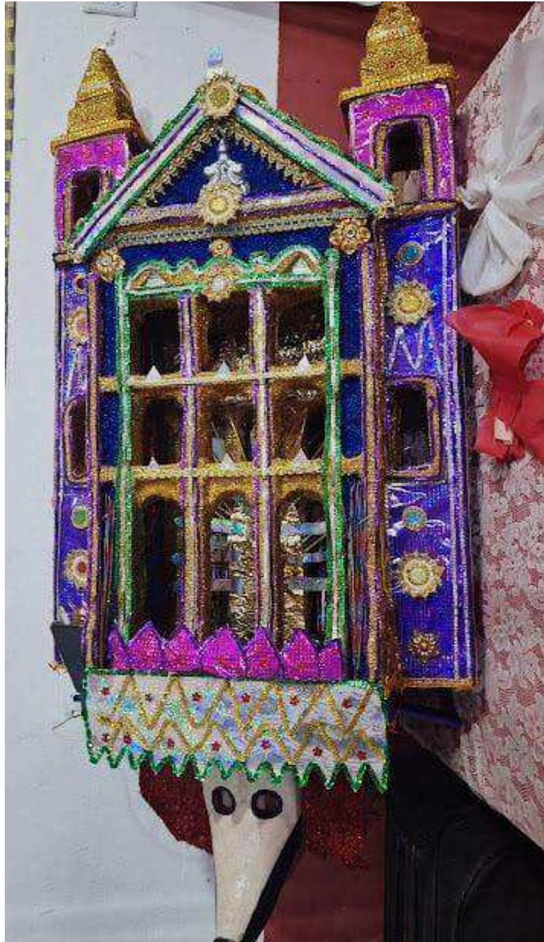
Fotografia 13: A careta do Cazumba "Bulão", hoje falecido, é a maior e mais adornada de todas, carrega a história e a saudade de seu antigo dono. Após um período aposentada, ela retorna aos folguedos, e seu peso físico e emocional é suportado por brincantes que, mesmo exaustos durante as apresentações, fazem esse sacrifício para honrar a tradição e a memória que ela representa.