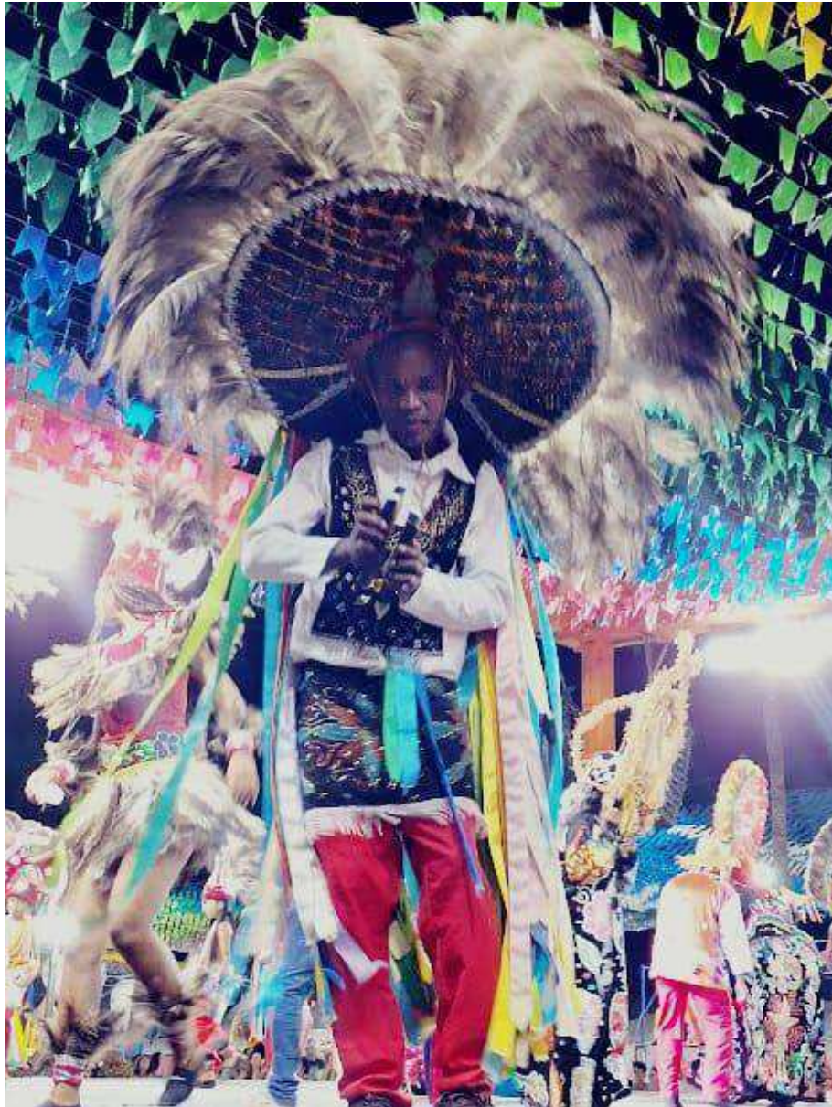
Fotografia 14: Em plena performance, um brincante do Boi de Pindaré se entrega à dança. Com seu pesado chapéu adornado de canutilhos, penas de ema e longas fitas coloridas, ele marca o ritmo com a matraca e o semblante profundamente concentrado nas toadas que guiam sua apresentação.