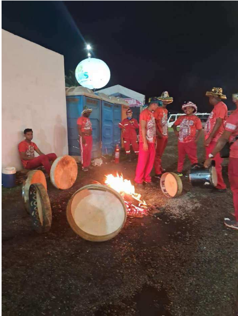
Fotografia 11: Preparação para o espetáculo: em junho de 2024, na praça Maria Aragão, batuqueiros aquecem os pandeiros de couro que marcarão o ritmo da apresentação do Boi de Pindaré.