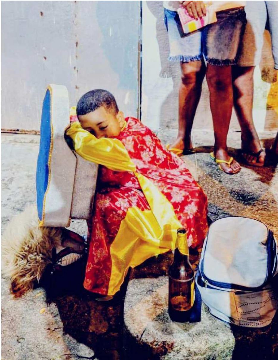
Fotografia 7: Cazumba criança descansando na calçada depois de uma noite de boiadas, exausto repousa sobre a sua careta, junho de 2023.