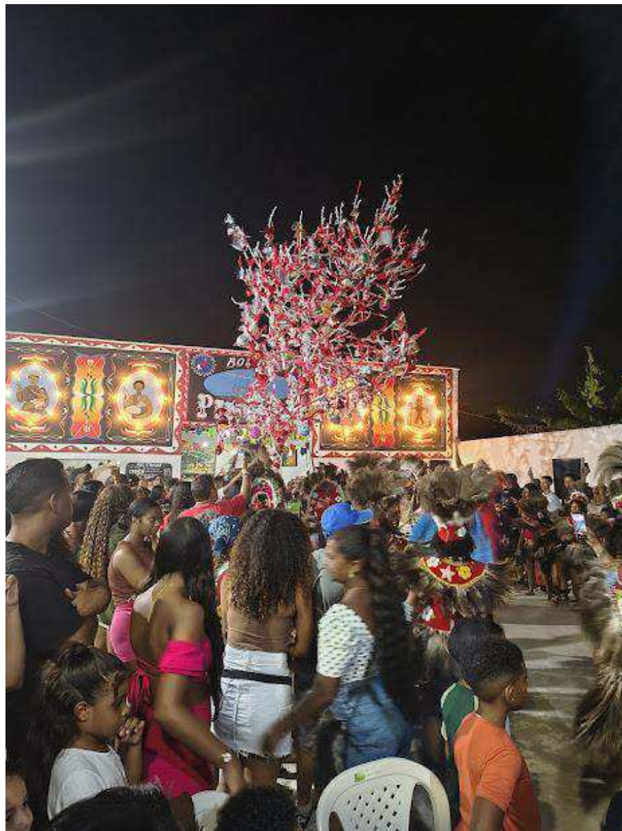
Fotografia 18: Momento ritual de morte do boi: a quebra do mourão. Após ser buscado e erguido pelo grupo, o mourão — doado por um membro da comunidade — é derrubado, liberando uma chuva de presentes para as crianças e pessoas do Bairro de Fátima. Este ato simboliza a partilha e a integração do boi com toda a comunidade do Bairro de Fátima.