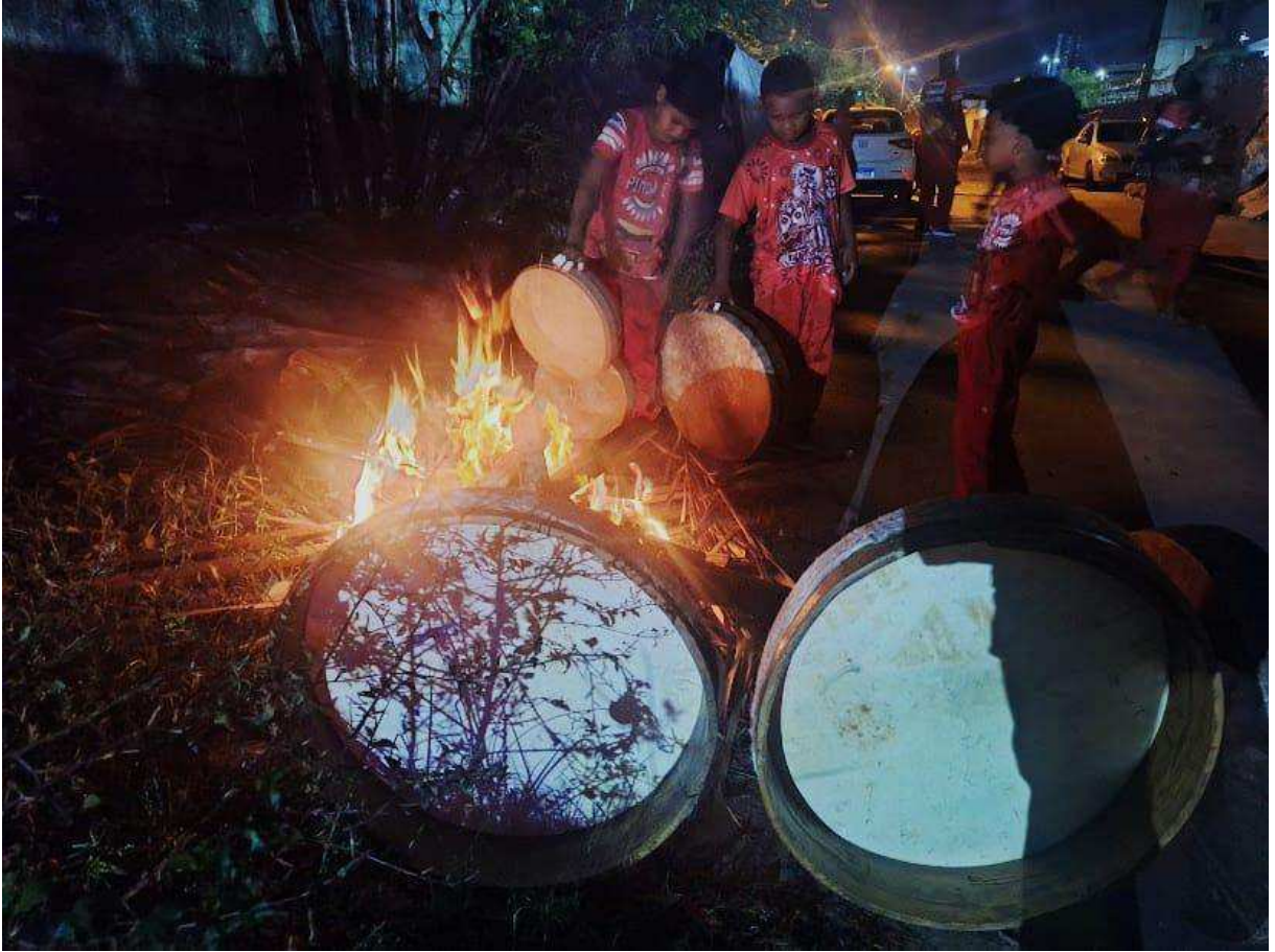
Fotografia 6: Crianças do batuque do Boi de Pindaré aquecendo os tambores no calor da fogueira, essa técnica é utilizada para afinar os pandeirões de couro. Essa imagem faz lembrar uma fala importante de seu Nato (chefe dos batuqueiros) sobre a importância de ensinar as crianças: “Nunca se deve subestimar o poder do toque de uma criança, pois amanhã ele pode se tornar um grande batuqueiro”.