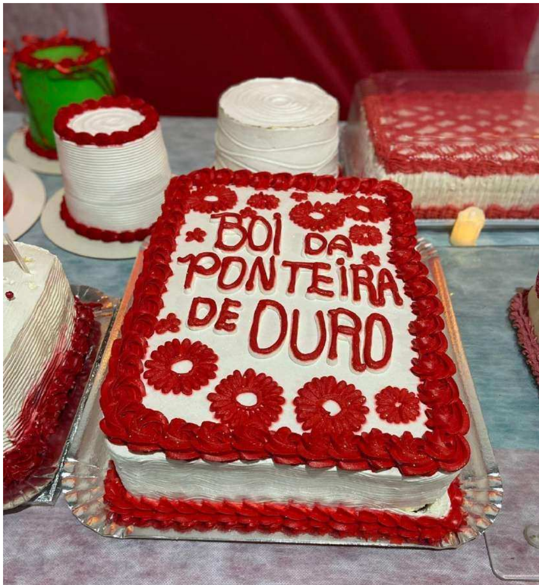
Fotografia 17: O corte dos bolos no terceiro dia do ritual de morte do boi: um gesto que encerra a temporada junina. Confeccionados a partir de doações de simpatizantes do Boi de Pindaré, sua distribuição simboliza a comunhão e o agradecimento à comunidade após o ciclo de celebrações, marcando o fim da grande festa do bumba-meu-boi.