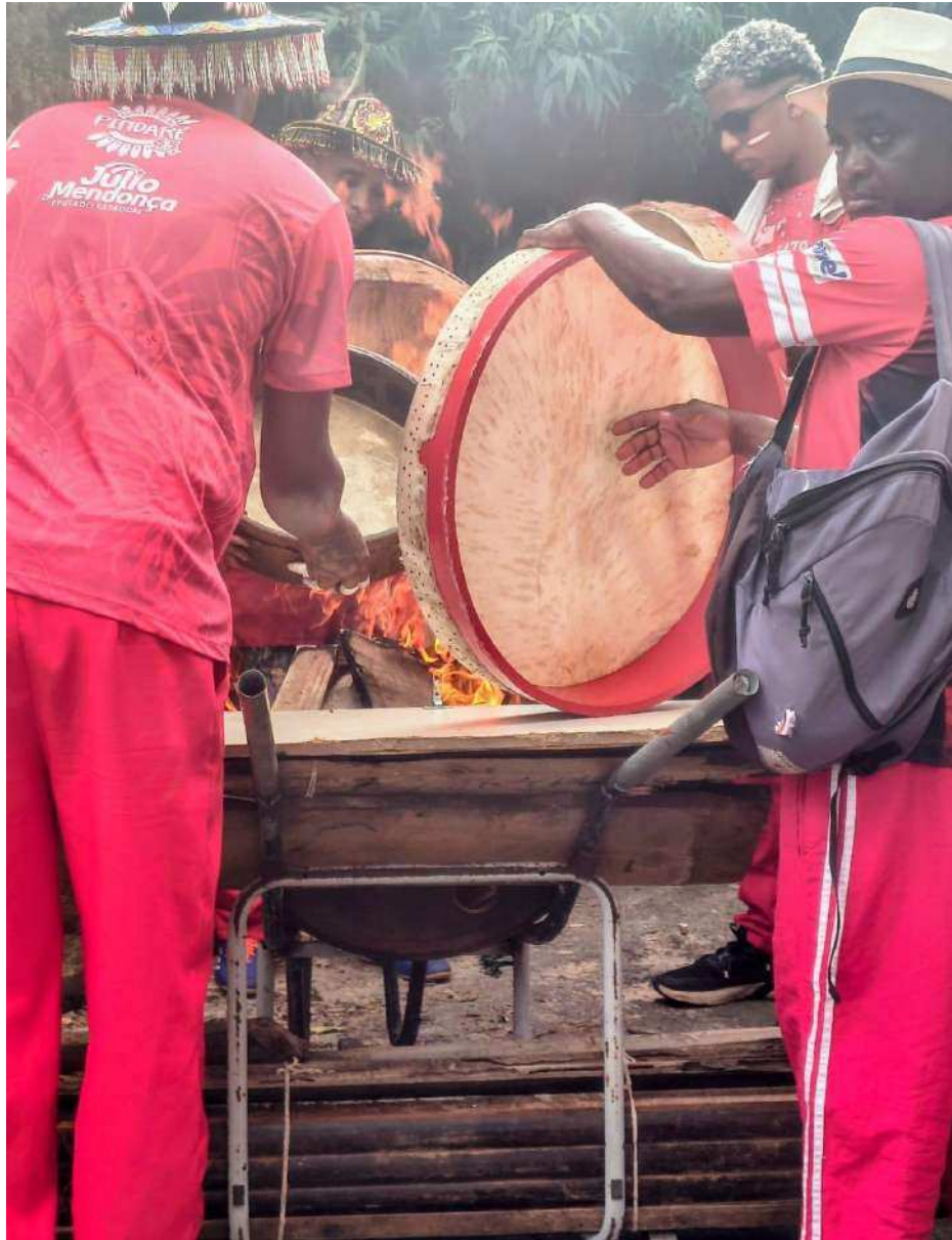
Fotografia 10: Mais que uma chama, um ritual: o fogo que aquece os tambores é o mesmo que acolhe os batuqueiros do Boi de Pindaré. No dia de São Pedro, na Madre Deus, o círculo em torno das chamas une o sagrado e o profano, preparando não só o couro dos pandeiros, mas também o espírito para a celebração. (29 de junho de 2025)