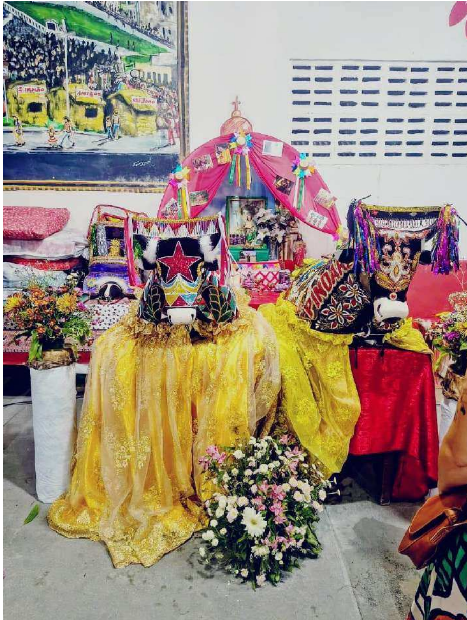
Fotografia 12: Na véspera do dia de São João, 23 de junho de 2025; os brincantes prestam homenagem ao santo junino e ao boi batizado. Momento de fé e tradição, que antecede o batizado, é um ritual para garantir uma boa temporada de festas. Batizou, batizou, Boi de Pindaré batizou , entoam os amos e cantadores depois do ritual.