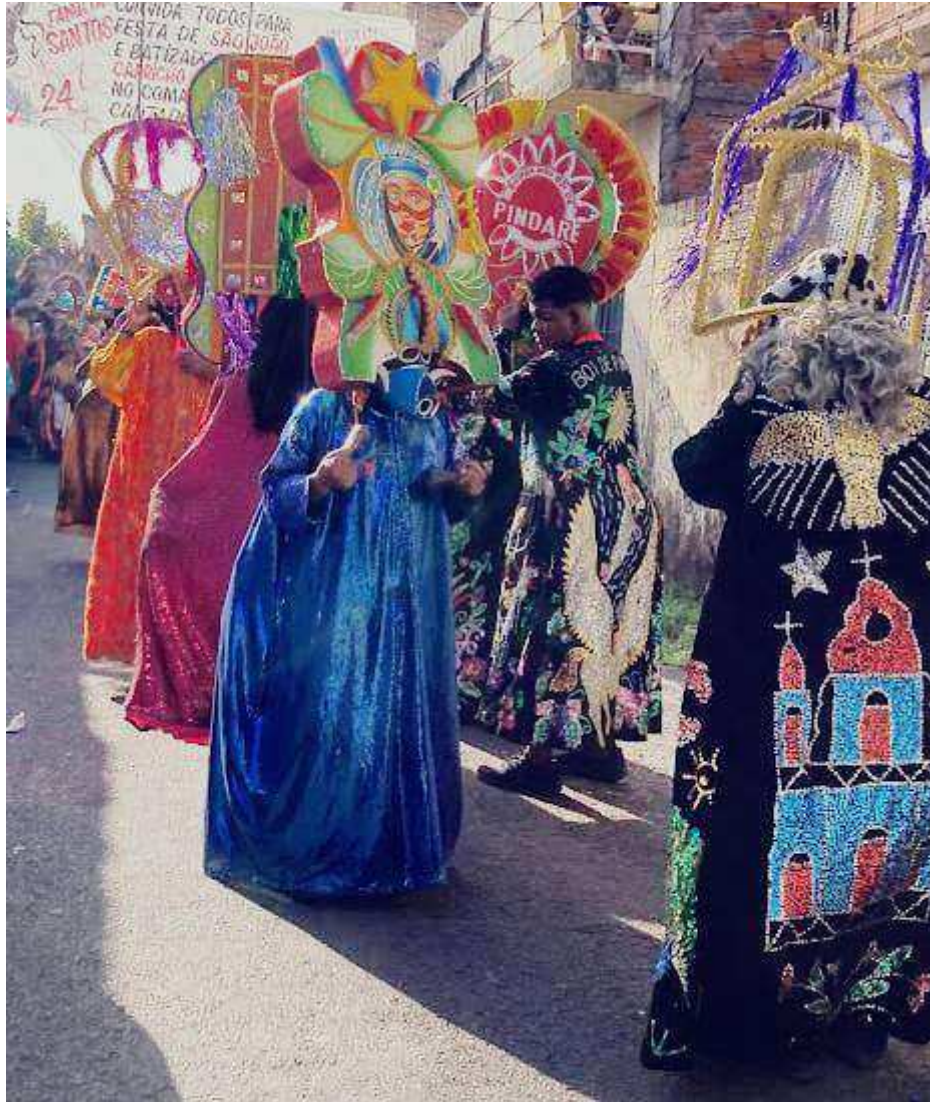
Fotografia 5: Cazumbas no local de concentração do Boi de Pindaré antes de descer as ruas da Madre Deus, rumo à Capela de São Pedro. Com suas batas bordadas com imagens de igrejas, pomba da paz/divino, brilhosas e estampadas, carregam enormes caretas que representam espíritos e animais; na história do Bumba, os cazumbas representam entidades responsáveis por perturbar os sonhos de Pai Francisco, quando está fugindo do amo /dono da fazenda, de quem sua esposa quer comer a língua do boi.