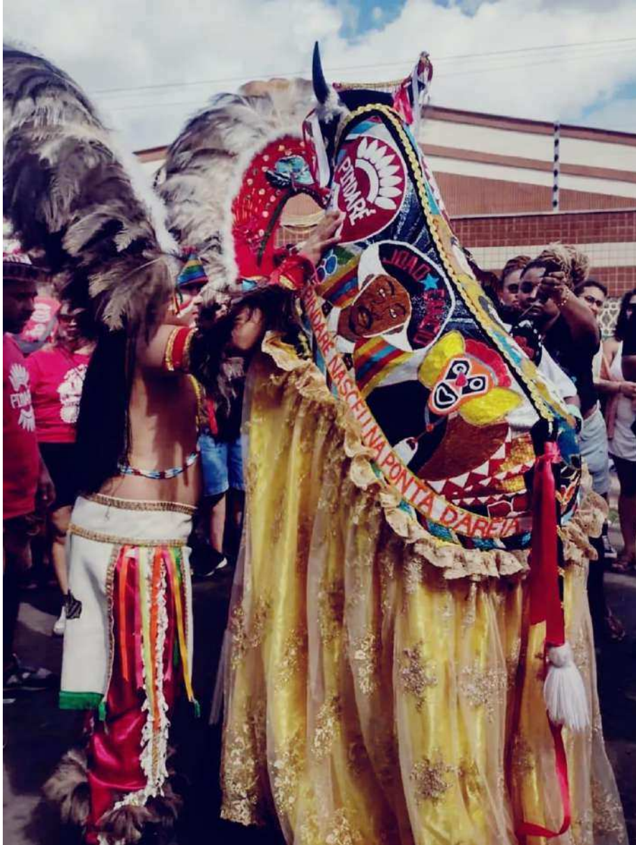
Fotografia 15: Momento ritual do Bumba-meu-boi em São Luís: um índio conduz a figura do Boi na saída da Casa das Minas, no bairro da Madre Deus. O cortejo, seguido por uma multidão, representa o recebimento de bênçãos das entidades, em uma tradição que mantém viva a cultura e a espiritualidade maranhenses.