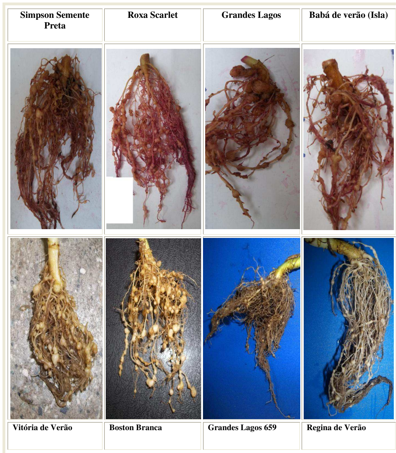
Figura 3- Sistema radicular (natural e coradas com fucsina ácida) das cultivares de alface suscetíveis ao Meloidogyne enterolobii .