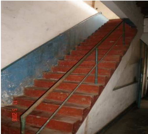
Foto 11- Detalhe da escada.