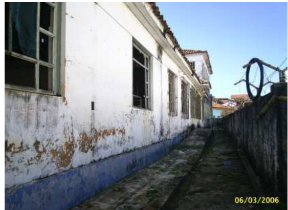
Foto 3- Vista da Fachada Lateral direita