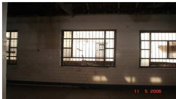
Foto 10- detalhe da esquadria.