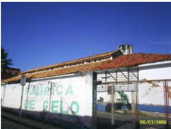
4- Vista do Portão de Acesso principal