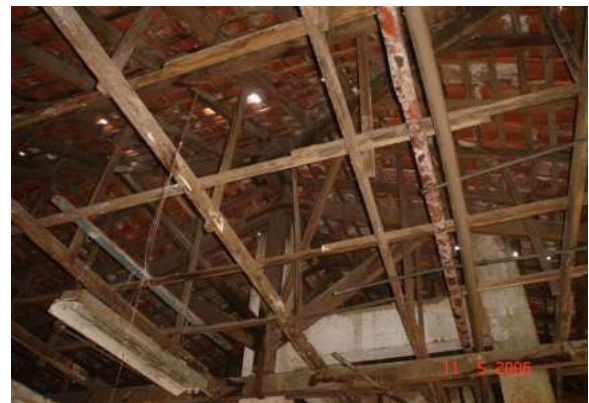
Foto 9- Detalhe do telhado.