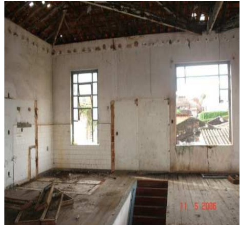
Foto 12- Pavimento Superior.