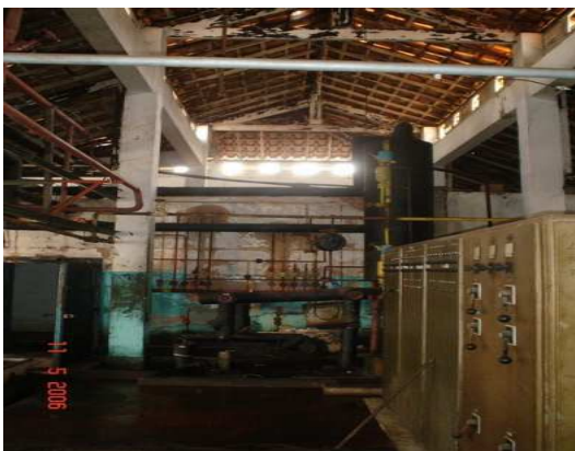
Foto 8- Vista da circulação interna.