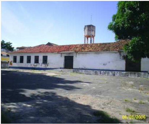
Foto 2- Vista da Fachada Principal