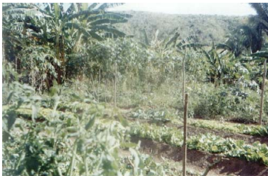
Figura 9: Quintal Agroflorestal no povoado Centro do Henrique

Em um dos quintais (A3 P1) foi encontrado uma horta com canteiros no chão contendo alface, couve, tomate, pimentão e outras espécies. Está localizado no povoado Centro do Henrique e a horta pode ser vista nas figuras 9 e 10.