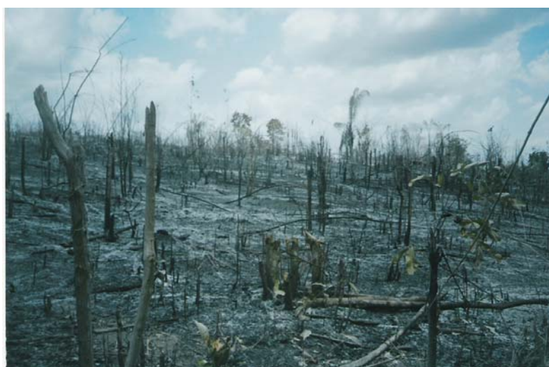
Figura 17 : Queimada: na agricultura de subsistência

A agricultura de subsistência de corte e queima para a implantação de culturas anuais, no município de Esperantinópolis, também contribui para a degradação ambiental principalmente a redução da capacidade produtiva do solo (Figura 17)