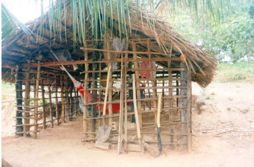
Figura 11: Abrigo para trabalhador e ferramentas.