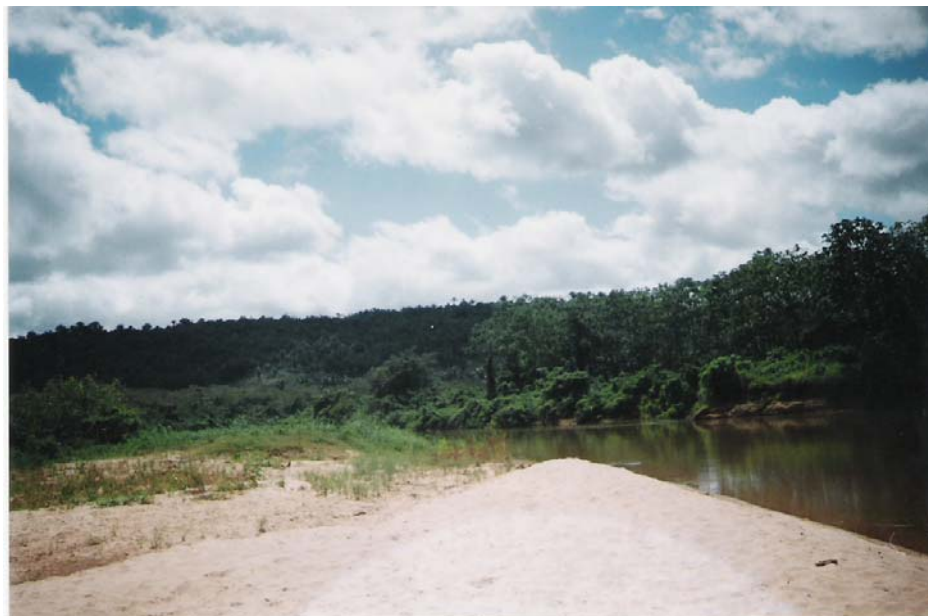
Figura 14: Assoreamento do Rio Mearim no município de Esperantinópolis

Outra evidência da degradação ambiental no município é a supressão e queimada da vegetação das encostas para a implantação de pastagens destinadas à criação de gado bovino.(Figuras 15 e 16)