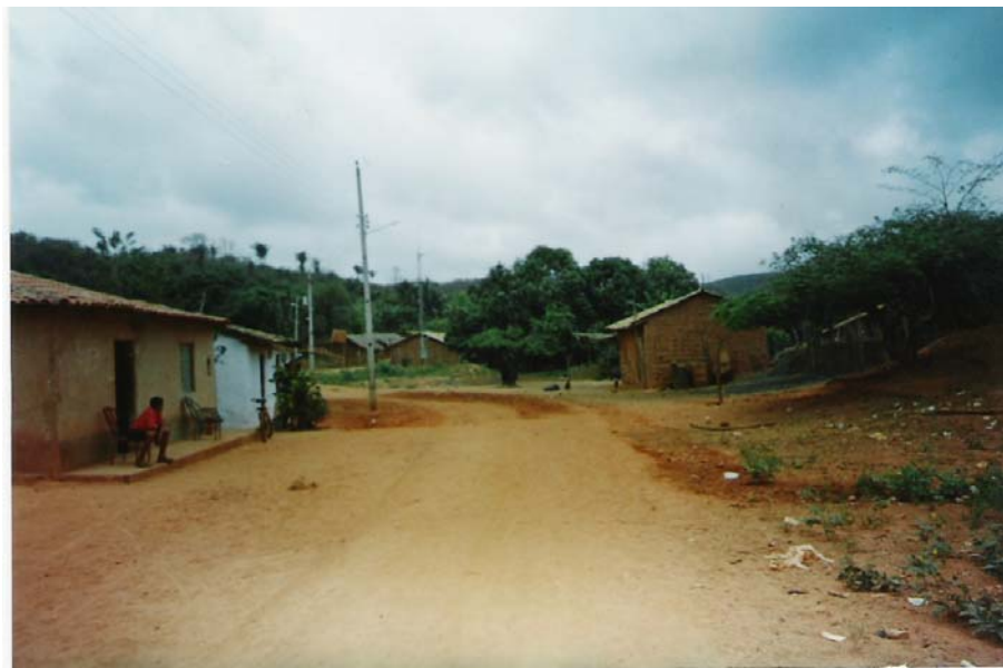
Figura 4: Povoado Sumaúma