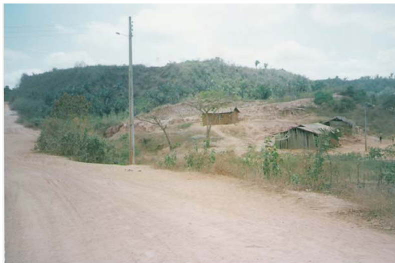
Figura 2: Povoado Centro do Pedrão