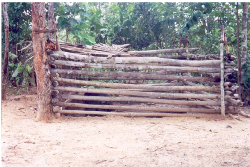
Figura 13: Abrigo para suíno