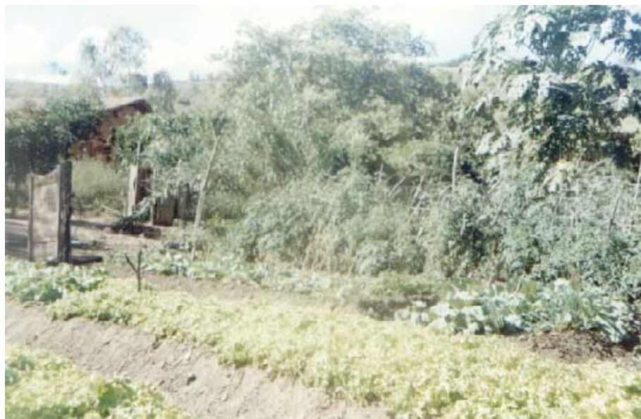
Figura 10: Detalhe da horta orgânica do Quintal Agroflorestal

Os sistemas identificados como agrofloresta encontram-se distantes da moradia (entre 1,5 a 3,0 km), e se caracterizam por conterem grande quantidade e variedade de espécies florestais incluindo palmeiras ( babaçu, macaúba e tucum); fruteiras tropicais, com predominância acentuada da bananeira e leguminosas adubadoras como feijão de porco, guandu e mucuna preta, intencionalmente inseridos no sistema, destinados à adubação verde. Encontram-se também nessas áreas o poço, destinado ao fornecimento de água para irrigação (manual) e suprimento humano e o racho (abrigo) destinado ao armazenamento de produtos (coco babaçu para quebra e frutas) que posteriormente serão transportados para o povoado, ao preparo de alimento em pequeno fogão à lenha ou carvão de coco babaçu que também é preparado no local e, descanso do trabalhador. O acesso a estes sistemas não permite a entrada de veículos nem de tração animal (carroça) pela inexistência de estradas e estarem localizados em áreas de relevo bastante acentuado, sendo extremamente difícil a retirada dos produtos o que ocasiona perdas consideráveis. Esta situação encontra-se bem caracterizada nos povoados Bom Princípio, Potó, Centro do Coroatá e Centro do Pedrão.