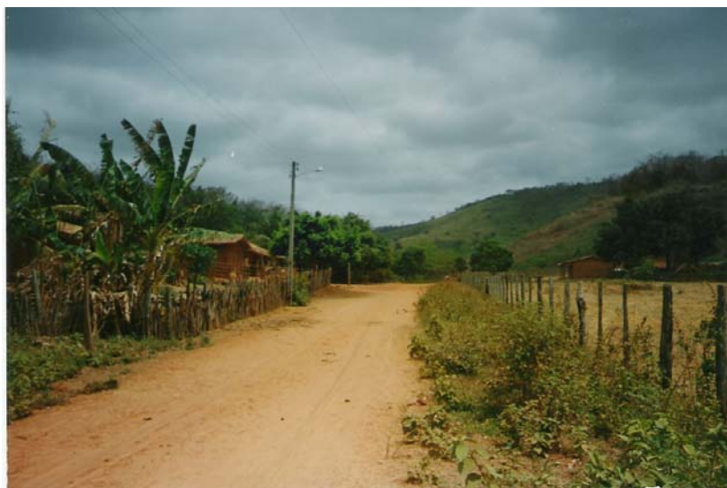
Figura 3: Centro do Henrique