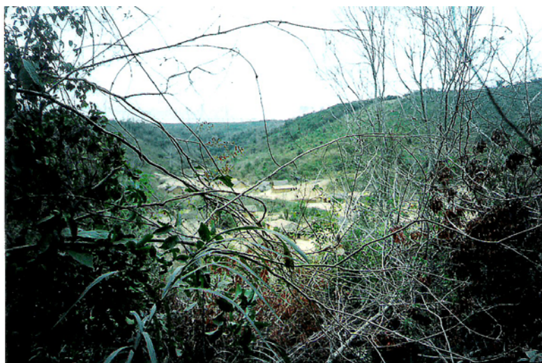
Figura 8: Povoado Centrão

No local onde hoje estão edificadas as residências dos moradores, foi há mais ou menos 40 anos atrás, um lago que, em virtude do desmatamento ocorrido para a implantação de roças e moradias sobre os morros e encostas, hoje está completamente assoreado.