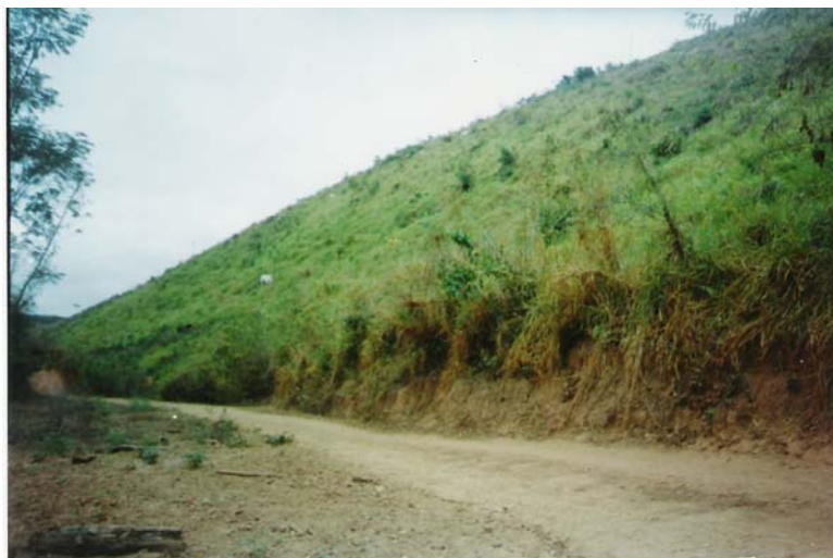
Figura 16 : Vegetação nativa da encosta substituída pela pastagem

A agricultura de subsistência de corte e queima para a implantação de culturas anuais, no município de Esperantinópolis, também contribui para a degradação ambiental principalmente a redução da capacidade produtiva do solo (Figura 17)