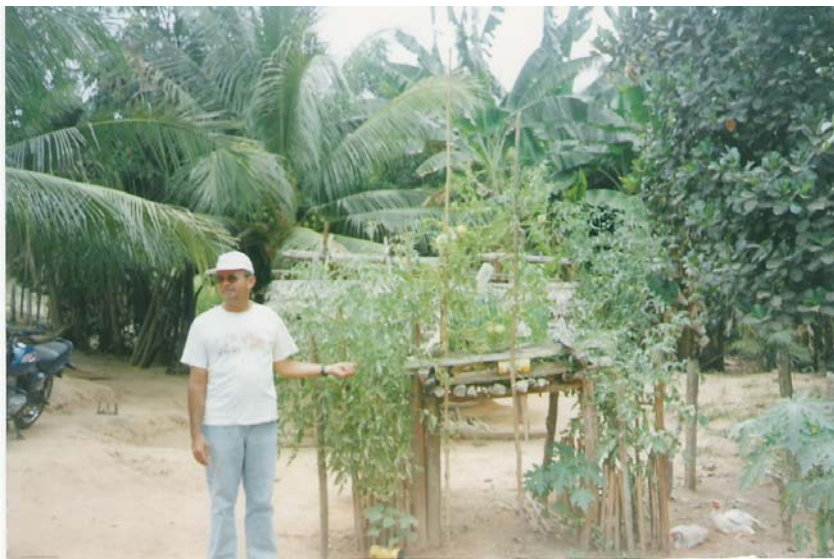
Figura 12: Jirau: canteiro suspenso. Estrutura típica muita encontrada nos Quintais Agroflorestais. Povoado Centro do Henrique