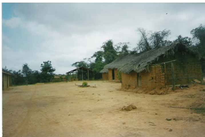
Figura 7: Povoado Serraria