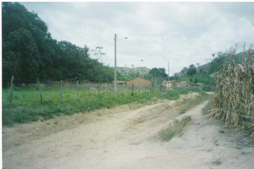
Figura 6: Povoado Jenipapo