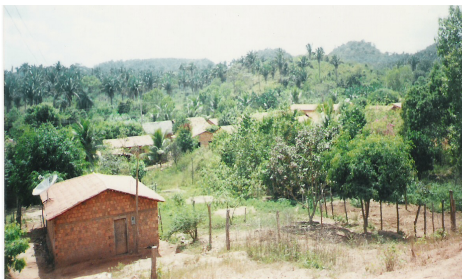
Figura 5: Povoado Centro do Coroatá