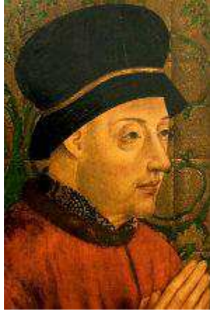
Figura 3 – D. João I (1385-1415). Autor Desconhecido.