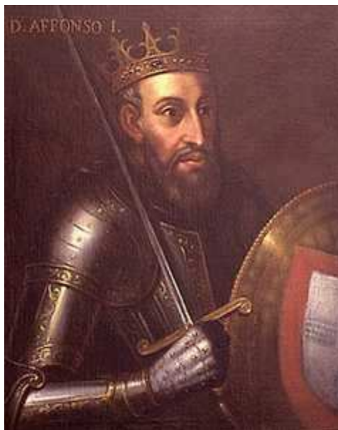
Figura 1 – D. Afonso Henriques (1139-1185).