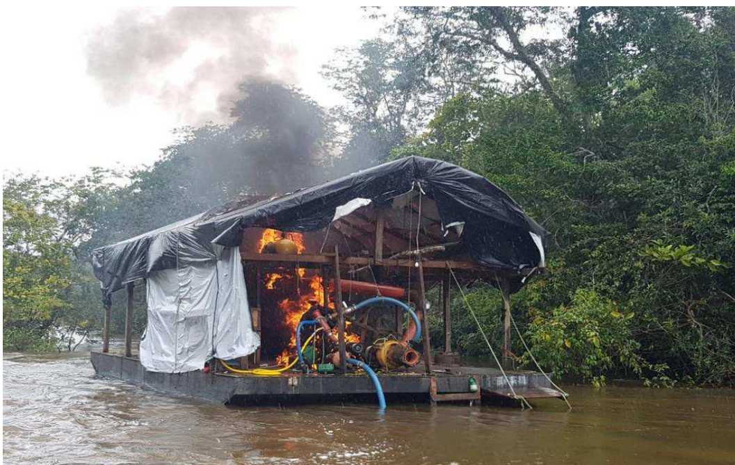
Figura 4 – Dragas de sucção de garimpo clandestino em Espigão D’Oeste (RO) sendo destruídas pela Polícia Civil durante a Operação Submerso