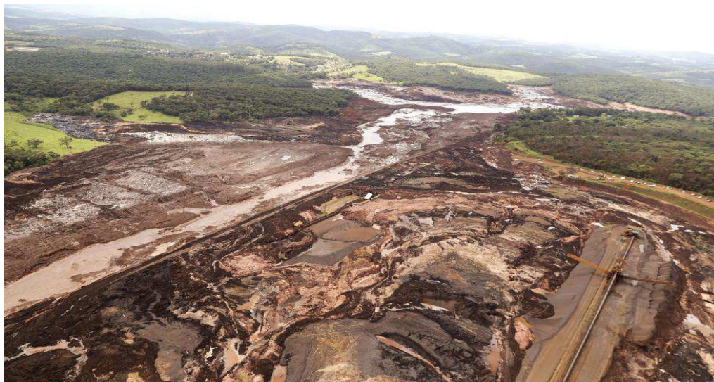
Figura 1 – Rompimento de barragem em atividade da mineradora Vale em Brumadinho (MG)