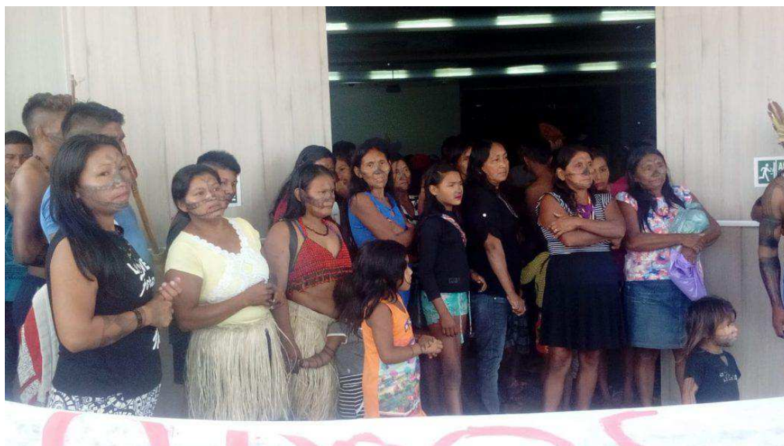
Figura 5 – Movimento Munduruku Ipereg Ayuse reunido para apresentar comunicado em audiência pública contra a mineração e o garimpo em terras indígenas

ganhar força muito antes dos relatórios do grupo GTMINERA), tem-se o exemplo do povo Munduruku, que apresentou um comunicado contra a legalização da mineração e do garimpo em terras indígenas, durante audiência pública em Itaituba (PA) cujo tema era “Mineração: Economia, Meio Ambiente e Sociedade”, convocado pela Subcomissão Permanente de Mineração, ligado à Comissão de Minas e Energia da Câmara dos Deputados (Cimi, 2019).