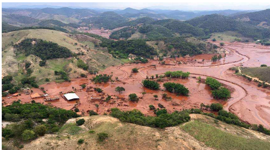
Figura 2 – Rompimento da barragem do Fundão da mineradora Samarco no município de Mariana (MG)

Em 2013, num contexto já marcado por políticas administrativas precárias adotadas pela Samarco, que passou a negligenciar ainda mais as medidas de controle e de fiscalização ambiental, o Ministério Público/MG solicitou um laudo acerca da existência de problemas de segurança nas atividades da empresa. O Instituto Prístino realizou o estudo e constatou riscos envolvendo a estrutura de barragens no subdistrito de Bento Rodrigues, em Mariana/MG (TEIXEIRA; LIMA; SILVA, 2019). O descaso com o problema, que durante todos esses anos foi anunciado e denunciado como uma tragédia iminente, culminou no rompimento da barragem do Fundão, em 2015, no município de Mariana/MG.