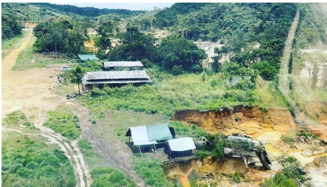
Figura 6 – Posto de saúde ao lado de garimpo ilegal

Entre 2020 e 2021, a Terra Indígena Yanomami teve registrados mais de 40 mil casos de malária, de acordo com o Sistema de Informações de Vigilância Epidemiológica (Sivep) do Ministério da Saúde. Dados alarmantes para uma população de que possui cerca de 30 mil pessoas. Entre 2018 e 2021 a área destruída pelo garimpo ilegal dobrou de tamanho, passando de 3,2 mil hectares (G1, 2023).