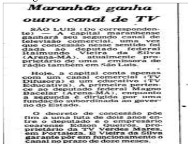
Imagem 2: Matéria sobre a TV Ribamar