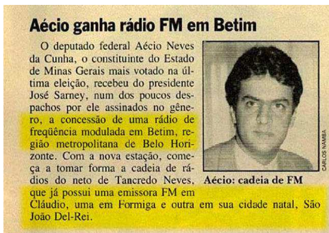
Imagem 1: Aécio ganha rádio FM em Betim