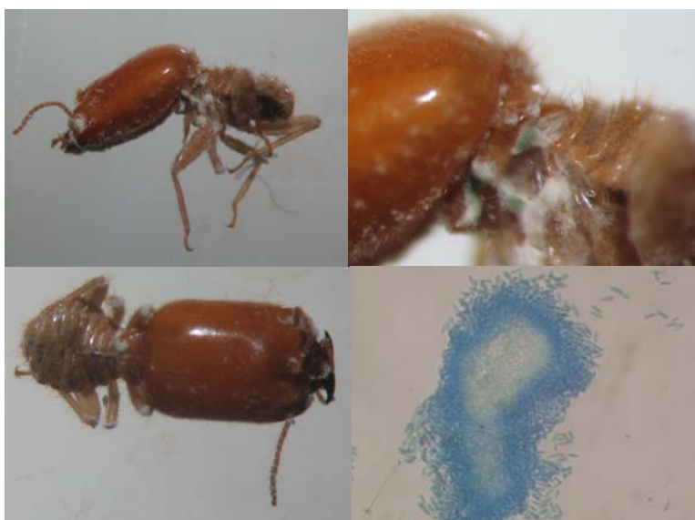
Figura 5. Formação micelial do fungo Metarhizium anisopliae em soldados de Cornitermes cumulans sete dias após a inoculação. São Luis – MA, 2008.

A colonização de M. anisopliae em C. cumulans foi observada entre o 6º e 7º dias de avaliação após a morte desses insetos nas concentrações testadas. Após uma semana de infecção o fungo já havia colonizado todo o corpo do inseto. A confirmação da infecção foi feita através da visualização de esporos do fungo retirados do corpo do inseto contaminado e visualizado em microscópio óptico (Figura 5). Os dados aqui obtidos diferem dos encontrados por Neves e Alves (2004) que observaram a ocorrência de colonização de C. cumulans por M. anisopliae entre 24h e 72h sendo que mais de 80% insetos morreram entre 72h e 96h.