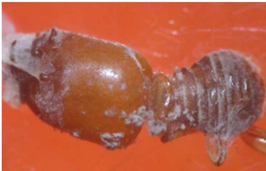
Figura 3. Soldado de Cornitermes cumulans infectado com Beauveria bassiana . ( 25 \pm 2^{\circ}\text{C} ; 70 \pm 10\% U.R. e escotofase contínua). São Luís – MA, 2008.