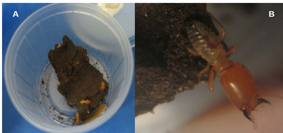
Figura 1. (A) Recipiente com o material cartonado, disco de papelão e Cornitermes cumulans ( 25 \pm 2^{\circ}\text{C} ; 70 \pm 10\% U.R. e escotofase contínua). (B) soldado de Cornitermes cumulans sobre o material cartonado. São Luis (MA), 2008.

Foram realizados dois ensaios, um com B. bassiana e outro com M. anisopliae . Utilizou-se copos plásticos com capacidade para 100 mL (Figura 1), contendo 10 g do material cartonado retirado diretamente do cupinzeiro e um disco de papelão corrugado umedecido com água destilada de 1,5 cm de diâmetro de acordo com a metodologia proposta por Soares et al. (2008).