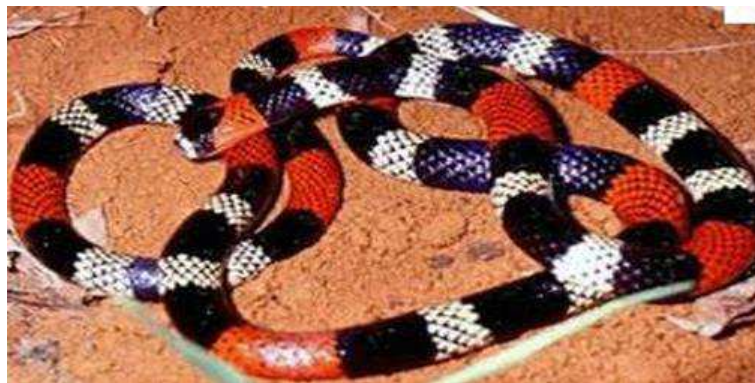
Figura 04: Serpente Micrurus e Leptomicrurus

As cobras corais (do gênero micrurus e leptomicrurus ) não apresentam fosseta loreal, possuem cabeça e pupilas arredondada e as escamas dorsais lisas. Destacam-se pelos anéis de cor preta, amarelos ou brancos e vermelhos (MOTA, 2017).