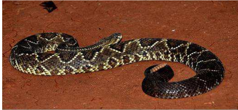
Figura 03: Serpente Crotalus durissus