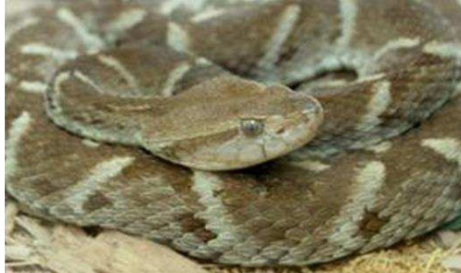
Figura 01: Serpente Bothrops