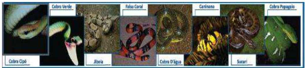
Figura 05: Serpentes não peçonhentas

Portanto, diversos gêneros de serpentes consideradas não-peçonhentas (Foto 5) ou de menor importância médica são encontrados em todo o país, sendo também causa comum de acidentes: Phylodrias (cobra-verde, cobra-cipo), Oxyrhopus (falsa-coral), Agkistrophis (boipeva), Helicops (cobra d'água), Eunectes (sucuri) e Boa (jiboia), dentre outras (OLIVEIRA et al., 2020).