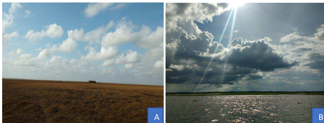
Figura 2 – Campo de captura de pequenos mamíferos silvestres não voadores durante a primeira campanha (A). O mesmo campo da figura A, agora durante a terceira campanha (B).

sistemas lacustres permanentes (PINHEIRO, 2003). A sua dinâmica natural envolve dois períodos distintos, um período chuvoso, que acontece de janeiro a junho, onde os rios perenes transbordam e inundam os campos, e um período de estiagem, que acontece de julho a dezembro, onde os campos ficam secos, favorecendo o aparecimento da vegetação, que é constituída principalmente de gramíneas e ciperáceas (COSTA NETO, 1990).