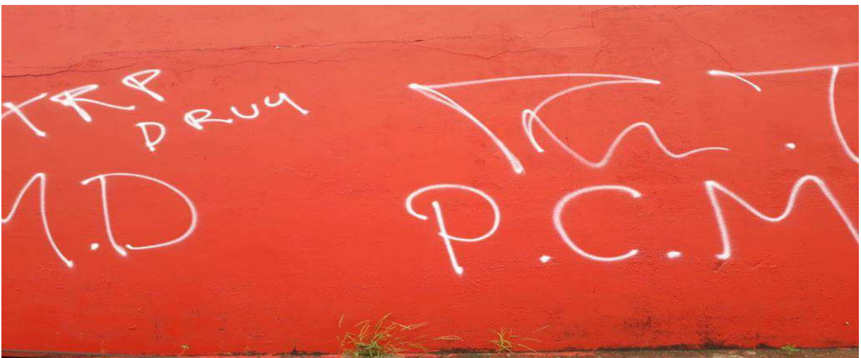
FIGURA 8: Pichação no muro do Nacional Gás, na Av. Brasil na Cidade Olímpica.