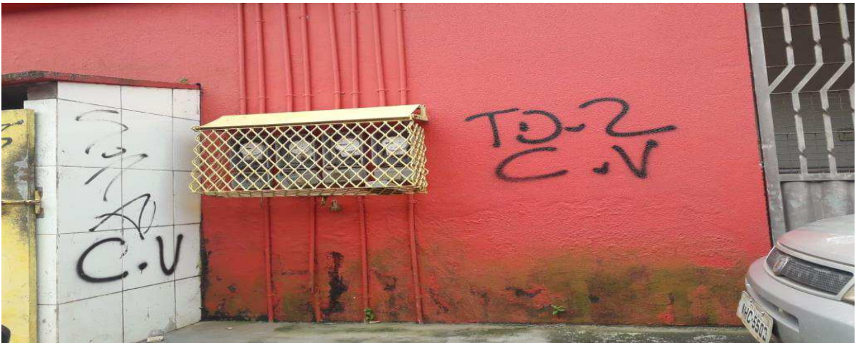
FIGURA 9: Pichação no muro do figurorífico fribal no bairro Cidade Olímpica.

É importante salientar, que a região é alvo constante de ameaças de outras organizações criminosas, pois até meados de 2018 o bairro era subdividido entre vários organizações criminosas.