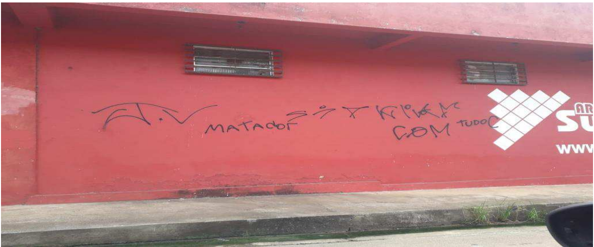
FIGURA 1: Pichação feita na parede lateral do Frigorífico da Fribal, localizado na Av.01.

Explicando a citação acima, cada região dominada pelas facções fica um líder encarregado de gerir os domínios das facção, estes são conhecidos como ‘torres’ ou ‘frente’, dependendo da organização criminosas, estes são auxiliados pelos chamodos ‘disciplinas’ que em caso em caso de quebra das normas impostas são os responsáveis para aplicar o que se convencionou chamar de tribunal do crime. É importante ressaltar a presença deste tribunal do crime no bairro da Cidade Olímpica, uma vez que o bairro tem a presença muito forte desses grupos.