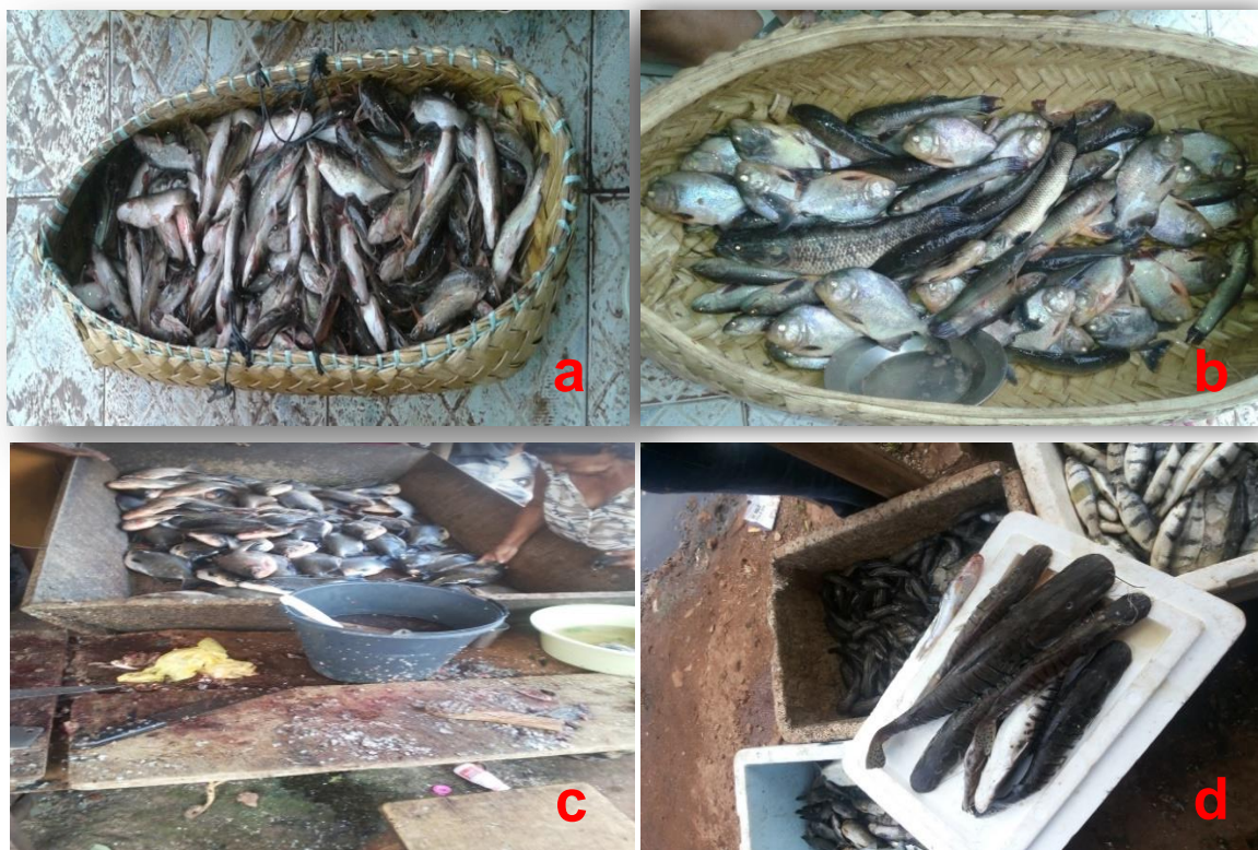
(a e b) armazenamento em recipientes de palha. (c) Utilização de utensílios de madeira para armazenamento, evisceração sem qualquer forma de conservação. (d) comercialização do peixe em caixa de isopor sem utilizar gelo para conservação.

Ressalta-se que o controle da temperatura durante a comercialização é de suma importância para garantir a qualidade e conservação, principalmente, do peixe que possui características favoráveis para o desenvolvimento de micro-organismos deteriorantes e patogênicos, assim é imprescindível conservar o peixe em temperaturas baixas, sobretudo em regiões tropicais, onde durante o verão as temperaturas são elevadas, exigindo um controle rigoroso para que suas propriedades organoléptica e nutricional sejam mantidas, além da segurança alimentar.