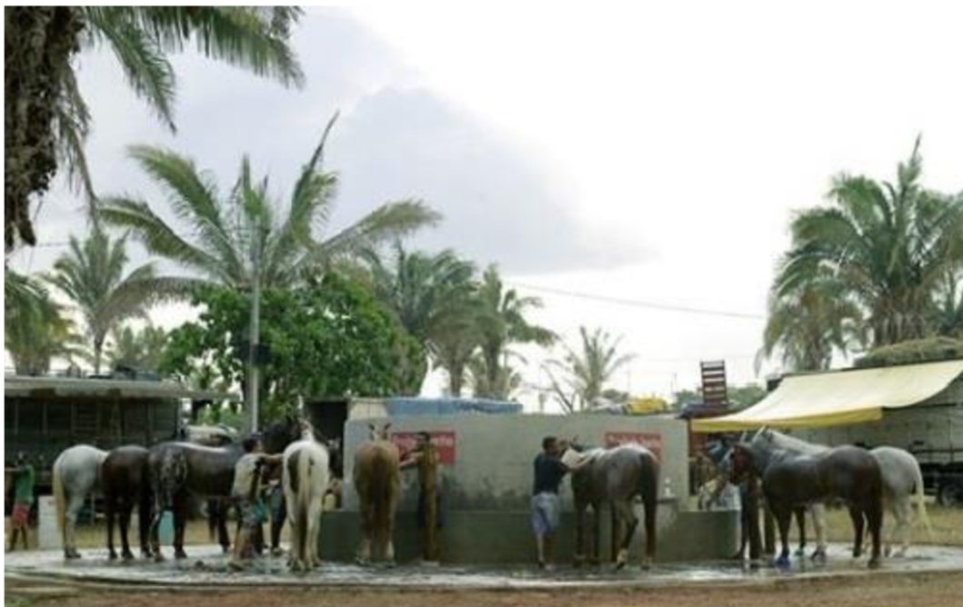
Figura1. Tanque de banho comunitário em vaquejada na região Tocantina Maranhense.