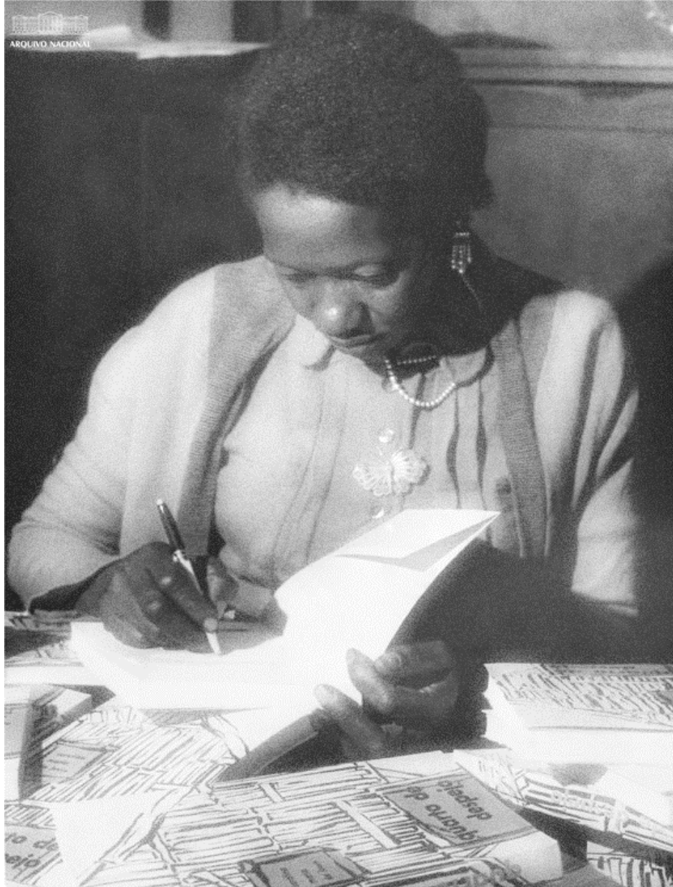
Figura 1 - Carolina Maria de Jesus em noite de autógrafos na livraria Francisco Alves-São Paulo.