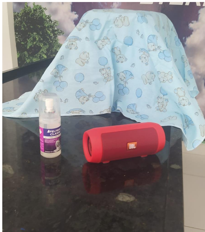
Figura 3 - Caixa de transporte coberta com toalha, caixa de som para música e frasco de Feliway