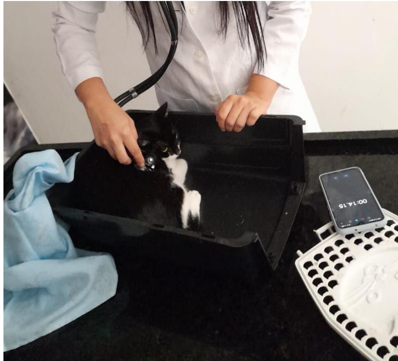
Figura 6 – Avaliação da frequência cardíaca em ambiente com manejo Cat friendly. (Fonte: autor).