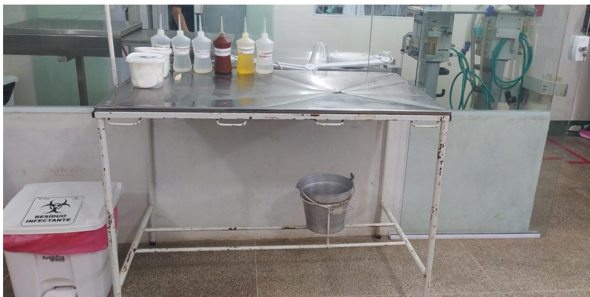
Figura 2 – Área de preparação pré-cirúrgica convencional do HVU/CCA/UEMA

Os animais do grupo Cat friendly foram mantidos em uma sala diferente da habitualmente utilizada na rotina, com pouca iluminação, pouco ruído, caixas cobertas, simultâneo a musicoterapia com som calmo, volume apropriado, sendo utilizado ainda um feromônio comercial (Feliway®) durante 10 minutos antes da administração da medicação pré-anestésica. Para tanto os 5 animais deste grupo foram selecionados de acordo com o temperamento dos animais do grupo controle para fins comparativos.