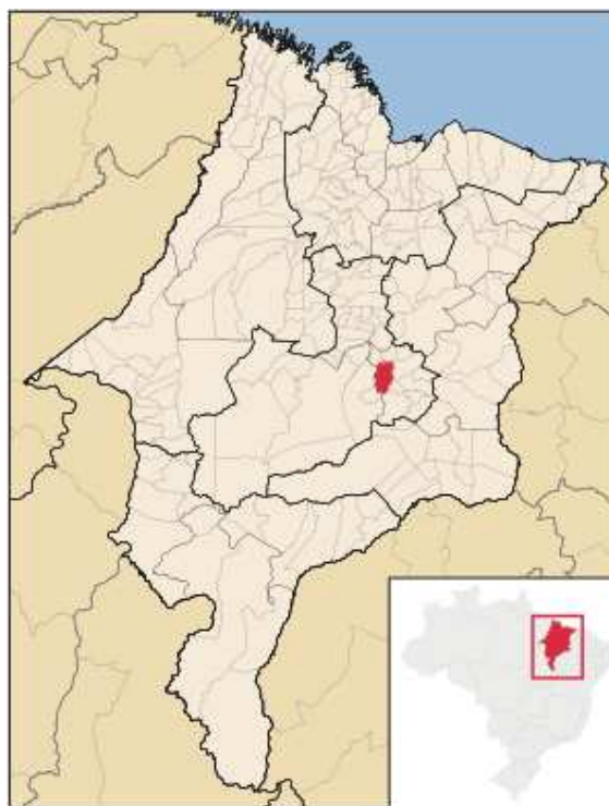
Figura 2. Mapa do Maranhão com destaque o município de Presidente Dutra.

Devido a sua localização privilegiada no estado do Maranhão, sendo assim, ponto de passagem e alto índice movimentação cambial. Tem também como destaque econômico o comércio, que é um dos principais itens da economia local.