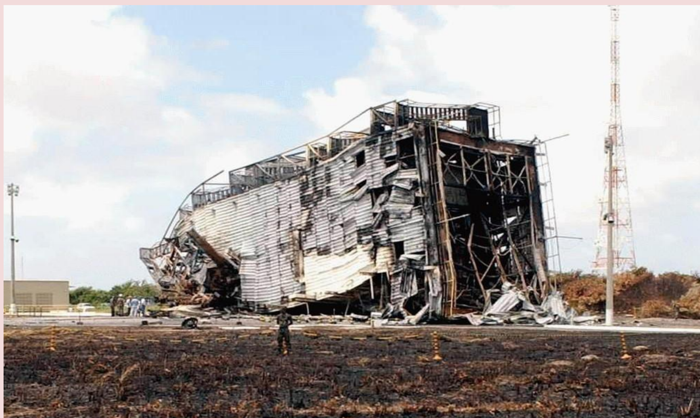
Base de Alcântara após o acidente em agosto de 2003.

Vale ressaltar que o Centro de Lançamento de Alcântara foi palco de tragédias em sua história, incluindo acidentes durante testes de foguetes que resultaram em perdas de vidas e danos materiais. O maior desastre da história do Programa Espacial Brasileiro aconteceu em 22 de agosto de 2003 2 , dias antes do lançamento do protótipo VLS-1 que colocaria em órbita dois satélites nacionais. Esse evento levou a uma revisão e reestruturação das operações no centro e a um foco renovado na segurança e na cooperação internacional no campo das atividades espaciais.