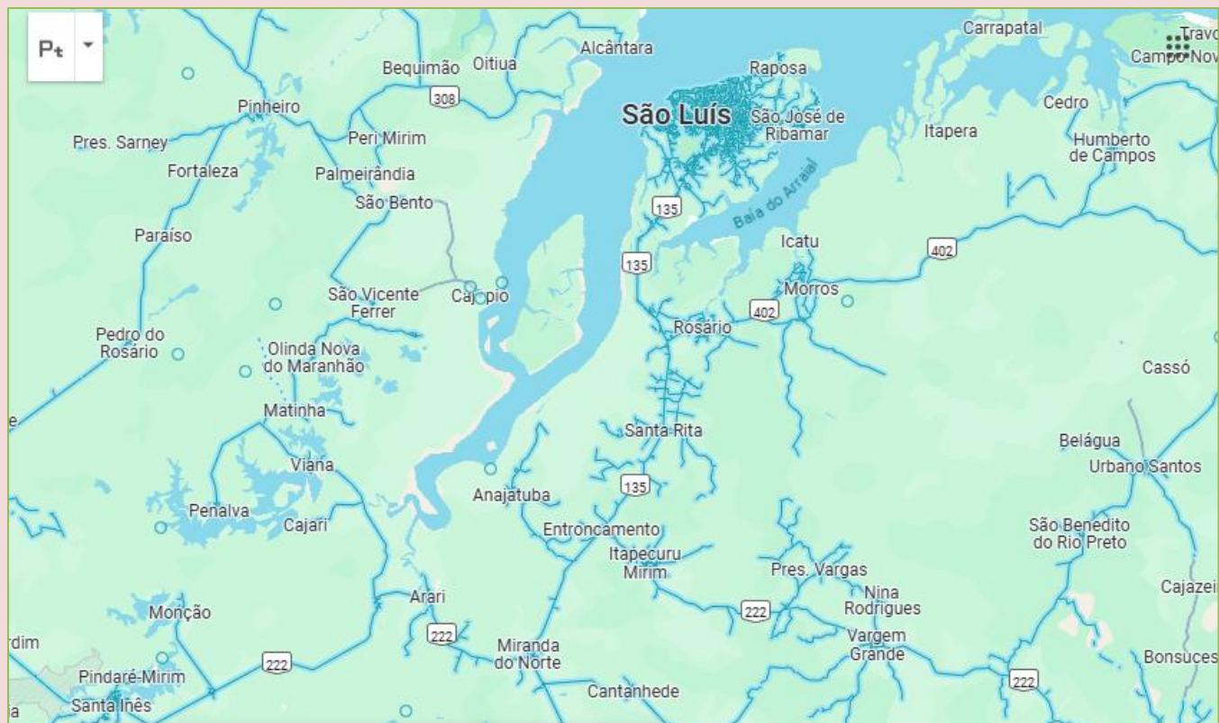
Mapa da região que compreende os municípios de Santa Rita, Anajatuba, Bacabeira e Itapecuru-Mirim (Fonte: https://www.google.com/maps/@-2.50287,-44.2194616,15z?entry=ttu&g_ep=EgoyMDI1MDYwNC4wIKXMDSoASAFAQAw%3D%3D ).

Nessa região, centenas de famílias vivem da pesca e agricultura complementando suas rendas através de programas sociais do Governo Federal como aposentarias e Bolsa Família. Como forma de combater essa situação de precariedade, em 2010 foi fundada a Associação de Moradores do Outeiro dos Pires (ASMOP) que, em 2012, anexou abaixo assinado ao inquérito civil público nº 1.19.000.001554/2010-87 aberto pelo povoado Retiro São João da Mata junto ao Ministério Público Federal.