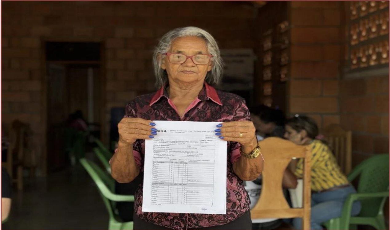
Imagem: assinatura de contrato em processo de reassentamento em Piquiá de Baixo – Açailândia (Fonte: https://piquiadebaixo.com.br/vitoria-da-esperanca-piquia-de-baixo-celebra-a-luta-e-conquista-de-moradias-longe-do-foco-de-poluicao-direta ), acessado em 18/05/2025.