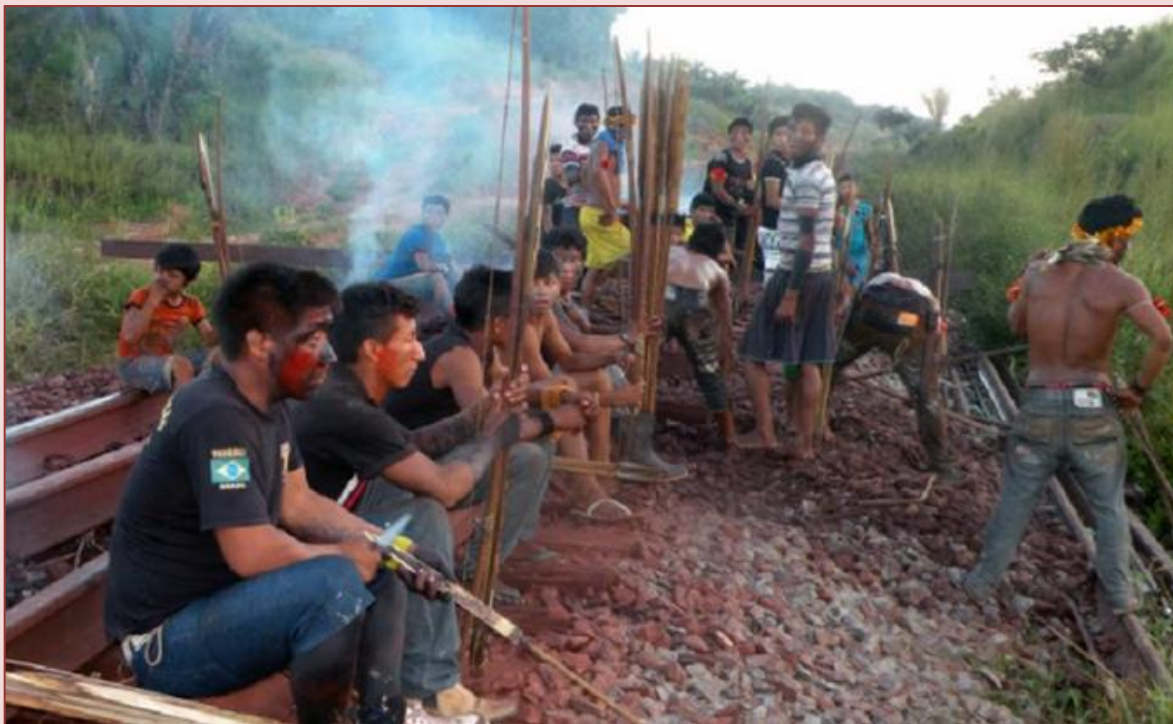
Ocupação de um trecho da Estrada de Ferro Carajás por comunidade indígenas do Maranhão / Rede Brasil Atual

(Fonte: https://www.brasildefato.com.br/2018/05/19/projeto-grande-carajas-desestrutura-comunidades-e-territorios-indigenas/ ).