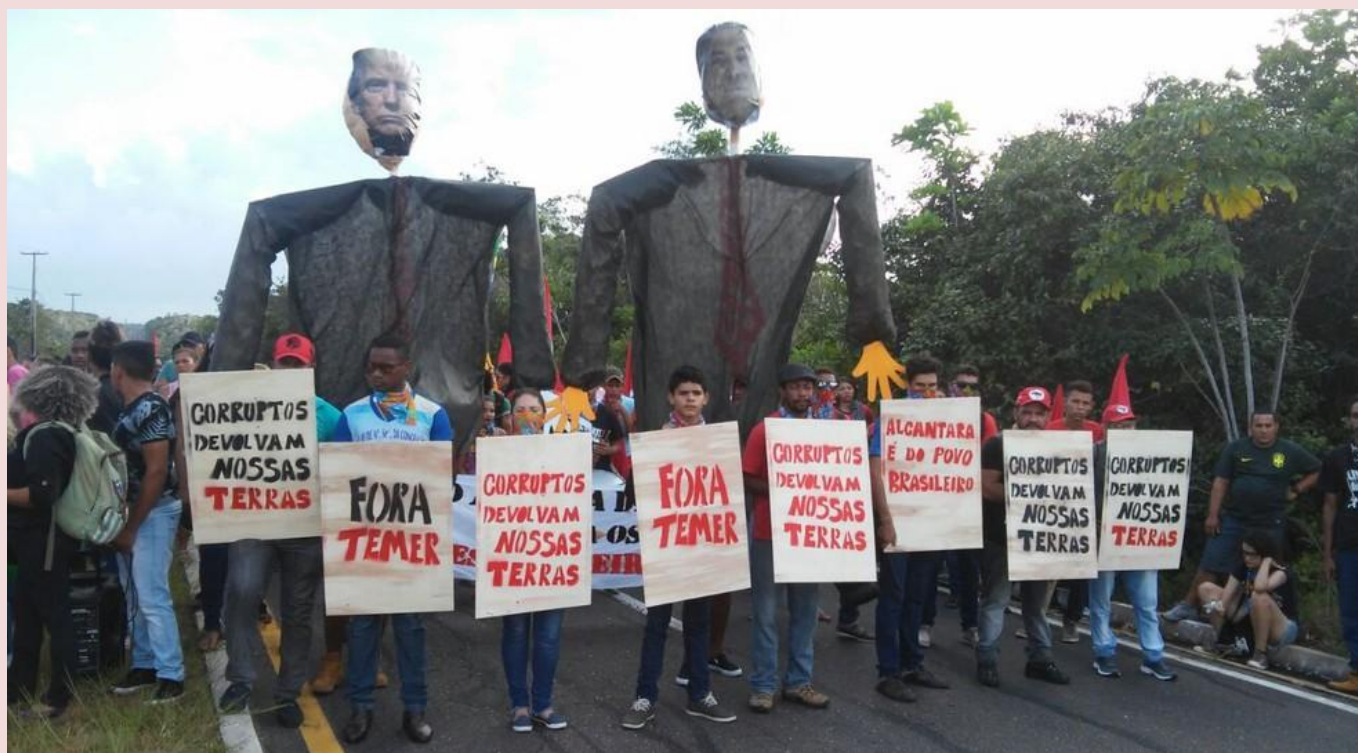
Imagens de protesto de que reuniu centenas de manifestantes em Alcântara (2012) – Foto G1 Maranhão.

Diante dessa realidade, as comunidades quilombolas de Alcântara desenvolveram diversas formas de resistência ao longo de décadas. Inicialmente, manifestou-se de forma mais individual e cotidiana, através da recusa em abandonar o território, da manutenção de práticas culturais tradicionais e da adaptação criativa às novas circunstâncias. Com o tempo, e especialmente após a redemocratização do país, a resistência ganhou contornos mais organizados e políticos, com a formação de associações comunitárias, articulação com movimentos sociais e organizações de direitos humanos, e o acionamento de instâncias judiciais nacionais e internacionais.