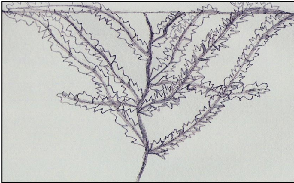
Figura 5. Esquema de planta conduzida sem poda