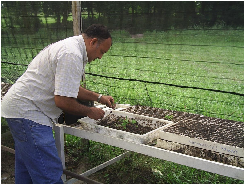
Figura1. Germinação das sementes de maracujazeiro em bandejas plásticas

Após sete dias da sementeira, observou-se o início da germinação das sementes. A germinação das sementes ocorreu de modo uniforme, com taxa acima de 80% para as sementes comerciais. Para as sementes retiradas de frutos obtidos em feiras, a germinação foi inferior a 50%. Passados trinta dias do início da germinação, foi feito o transplante das mudas para sacos de 1,0 L, previamente preenchidos na proporção de três partes de terra vegetal para uma parte de esterco de curral. Foram realizadas capinas e irrigação. Antes de completar 30 dias do transplante, foram eliminadas através de catação manual, larvas da borboleta Agraulis vanillae vanillae (L., 1758) e Dionne Juno Juno (Cr., 1779).