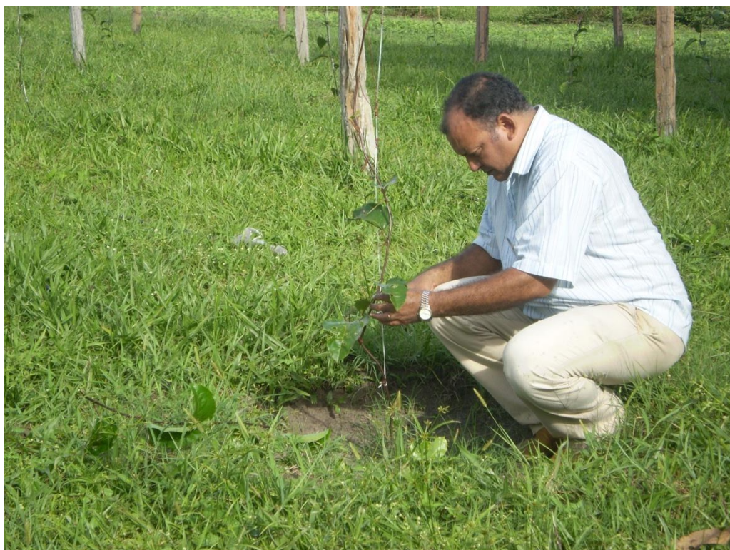
Figura 2. Transplântio de mudas de maracujazeiro para o local definitivo

Paralelamente, ao início do desenvolvimento das mudas, foram abertas as covas para o plantio definitivo das mudas no campo, obedecendo ao espaçamento de 4 m X 3 m. As covas foram abertas nas dimensões de 0,40 m x 0,40 m x 0,40 m. Estas covas receberam esterco bovino, na proporção de 20 litros por cova. No dia 05/05/2009, as mudas, já com cinco a seis folhas verdadeiras e 30 cm de altura, foram plantadas no local definitivo (Figura 2). No total foram plantadas 126 mudas (Quadro 1).