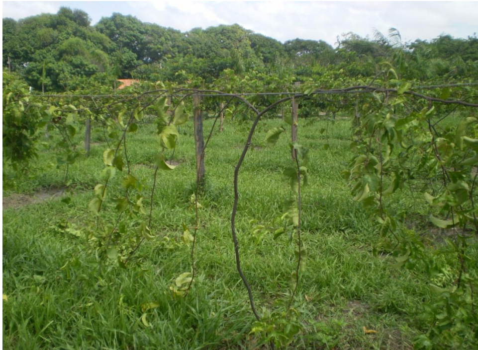
Figura 8. Planta conduzida com poda até a altura do arame e poda de formação