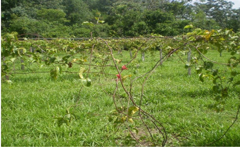
Figura 4. Planta conduzida sem poda