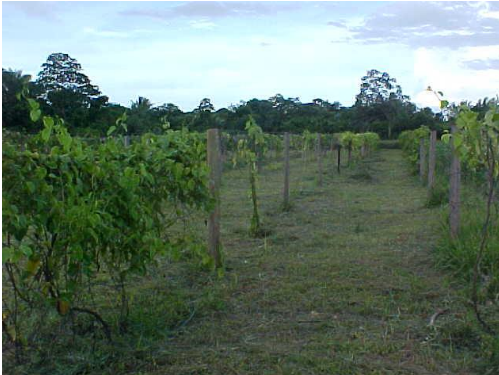
Figura 3. Sistema de condução utilizado no experimento

A partir de 17/07/09, foram realizadas as podas de condução, obedecendo aos tratamentos previamente estabelecidos: