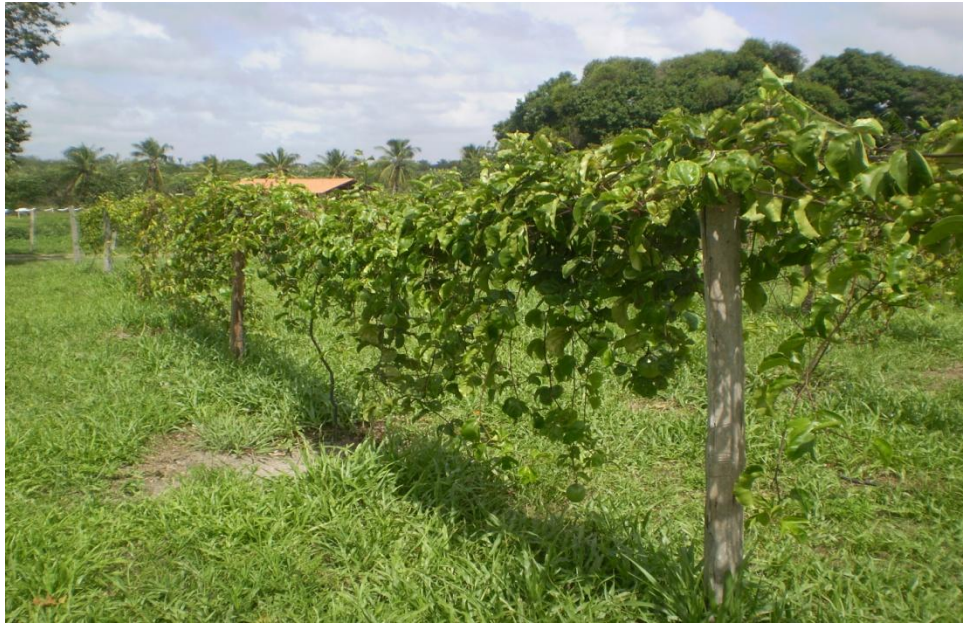
Figura 6. Planta conduzida com poda somente até a altura do arame