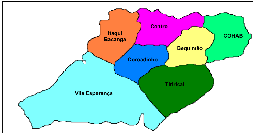
Figura 1 – Representação dos Distritos Sanitários do município de São Luís – MA.