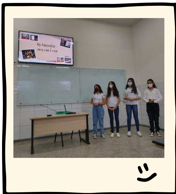
Apresentação de pesquisa em forma de exposição oral em evento científico do IFMA, campus Buriticupu