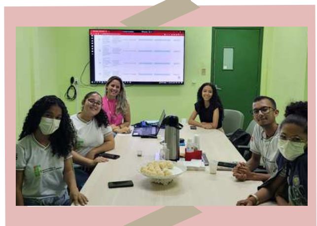
Reunião de orientação no IFMA, campus Buriticupu