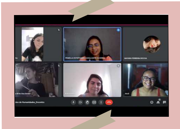
Reunião de orientação via google meet no período de distanciamento social