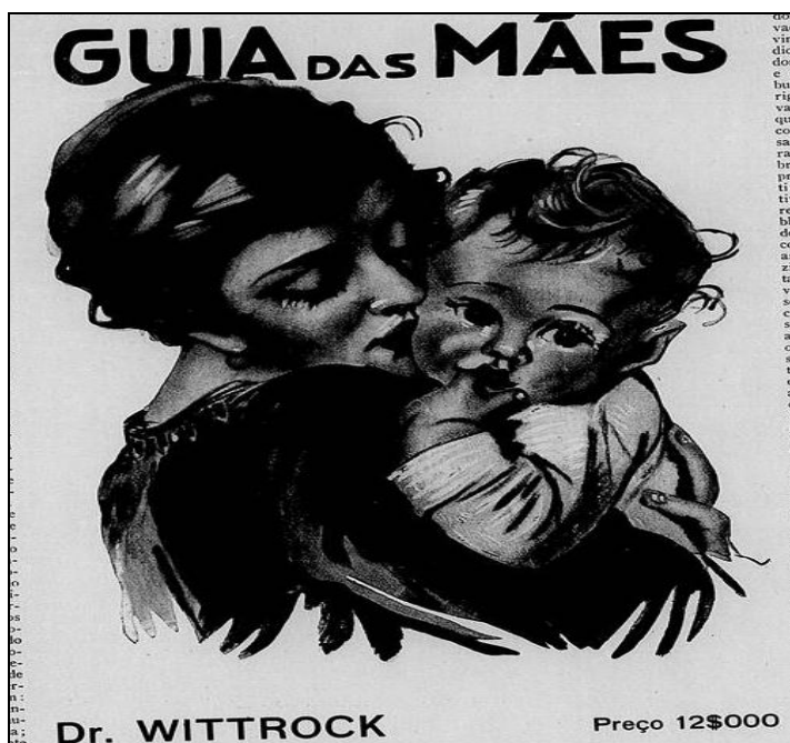
Figura 1 - Guia das mães